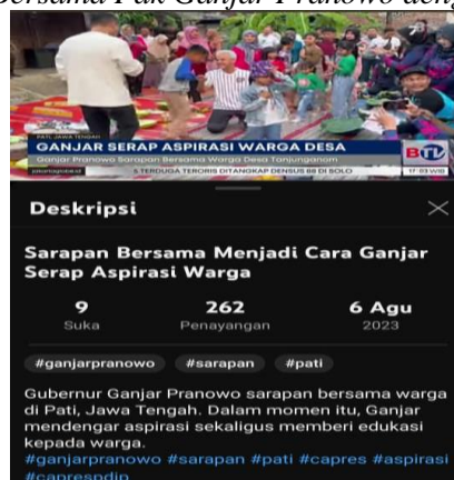
Momen Sarapan Bersama Pak Ganjar Pranowo dengan Masyarakatnya

Hal yang serupa juga didapatkan dari hasil pengamatan di media sosial YouTube. Dalam sebuah unggahan di media sosial YouTube, Pak Ganjar Pranowo terlihat melakukan aktivitas sarapan pagi bersama warga Kabupaten pati Jawa Tengah. Momen tersebut digunakan Pak Ganjar Pranowo untuk mendengarkan aspirasi masyarakatnya. Satu per satu warga mendapatkan kesempatan untuk berdialog dengan pak Ganjar Pranowo untuk mengutarakan aspirasinya. Namun pada kesempatan itu, pak Ganjar Pranowo tidak hanya sekedar menerima aspirasi dari masyarakatnya, melainkan sekaligus juga memberikan edukasi kepada masyarakatnya. Cuplikan aktivitas Pak Ganjar Pranowo tersebut dalam dilihat pada gambar berikut ini.