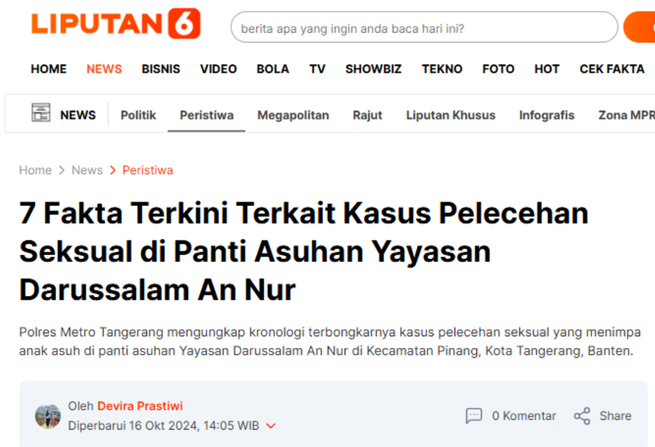
Gambar 3 Head Liputan6.com

melalui headline “ Biadab: Ketua dan Pengasuh Panti Asuhan Cabuli 8 Anak Asuh di Tangerang ” (Liputan6.com, 7 Oktober 2024).