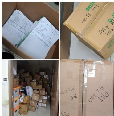
Gambar 4. Proses Penyusutan Arsip