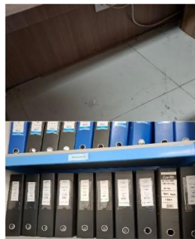
Gambar 6. Hasil dari Melakukan Penyusutan Arsip

Gambar menunjukkan hasil dari penerapan solusi atas permasalahan yang telah dilakukan. Peneliti telah melaksanakan penyusutan terhadap dokumen-dokumen inaktif serta melakukan perbaikan pada arsip yang mengalami kerusakan, seperti mengganti label yang tidak terbaca dan ordner yang tidak sesuai. Hasil dari kegiatan ini terlihat jelas meja kerja yang sebelumnya dipenuhi oleh arsip kini telah kosong dan tertata rapi, karena seluruh arsip telah dipindahkan ke tempat penyimpanan yang semestinya. Arsip-arsip tersebut kini disusun secara lebih terstruktur dan sistematis. Kondisi ini membuktikan bahwa penyusutan arsip inaktif dapat meningkatkan efektivitas pemanfaatan ruang penyimpanan serta mendukung terciptanya tempat penyimpanan yang lebih rapi dan efisien.