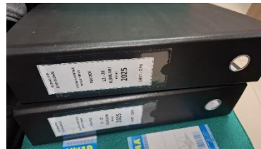
Gambar 5. Proses Perbaikan Arsip

Setelah melakukan penilaian arsip dan penyeleksian arsip tahap selanjutnya adalah melakukan penyusutan terhadap arsip-arsip yang sudah bersifat inaktif, khususnya dokumen dari tahun 2023 yang telah mendapatkan izin untuk disusutkan. Proses penyusutan dilakukan dengan memilah dan mengelompokkan dokumen-dokumen tersebut, kemudian menempatkannya ke dalam kardus. Setiap kardus diberi label sesuai dengan isi dokumen di dalamnya untuk memudahkan identifikasi. Setelah itu, kardus-kardus tersebut disimpan di gudang penyimpanan arsip inaktif sesuai prosedur kearsipan.