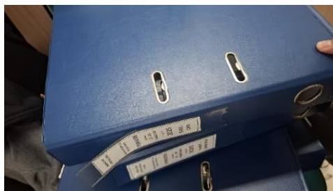
Gambar 3. Kondisi arsip yang rusak

Kondisi ruang arsip sebelum dilaksanakannya pemilahan dan penyusutan arsip menunjukkan bahwa penataan arsip masih jauh dari tertib dan terstruktur. Penempatan arsip terlihat berantakan, tidak sistematis, dan belum mengikuti prinsip-prinsip pengelolaan arsip yang baik. Arsip tahun 2023 yang seharusnya sudah dipindahkan ke ruang penyimpanan inaktif masih tersimpan di rak arsip aktif, sementara arsip-arsip terbaru justru diletakkan di luar area penyimpanan yang semestinya. Selain itu, terdapat banyak barang yang tidak berkaitan dengan aktivitas kearsipan bahkan sudah tidak lagi digunakan namun tetap disimpan di area tersebut, sehingga mempersempit ruang dan mengganggu fungsi utama ruangan sebagai tempat penyimpanan arsip. Kondisi ini tentu tidak sesuai dengan prinsip pengelolaan arsip yang efisien dan sistematis. Oleh karena itu, diperlukan penataan ulang terhadap ruang arsip serta pelaksanaan kegiatan penyusutan arsip, agar kapasitas ruang dapat dimanfaatkan secara optimal dan seluruh arsip tertata dengan lebih baik.