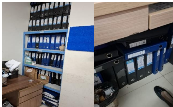
Gambar 2. Kondisi awal Arsip di divisi Finance Siloam Bekasi Timur

Kondisi ruang arsip sebelum dilaksanakannya pemilahan dan penyusutan arsip menunjukkan bahwa penataan arsip masih jauh dari tertib dan terstruktur. Penempatan arsip terlihat berantakan, tidak sistematis, dan belum mengikuti prinsip-prinsip pengelolaan arsip yang baik. Arsip tahun 2023 yang seharusnya sudah dipindahkan ke ruang penyimpanan inaktif masih tersimpan di rak arsip aktif, sementara arsip-arsip terbaru justru diletakkan di luar area penyimpanan yang semestinya. Selain itu, terdapat banyak barang yang tidak berkaitan dengan aktivitas kearsipan bahkan sudah tidak lagi digunakan namun tetap disimpan di area tersebut, sehingga mempersempit ruang dan mengganggu fungsi utama ruangan sebagai tempat penyimpanan arsip. Kondisi ini tentu tidak sesuai dengan prinsip pengelolaan arsip yang efisien dan sistematis. Oleh karena itu, diperlukan penataan ulang terhadap ruang arsip serta pelaksanaan kegiatan penyusutan arsip, agar kapasitas ruang dapat dimanfaatkan secara optimal dan seluruh arsip tertata dengan lebih baik.